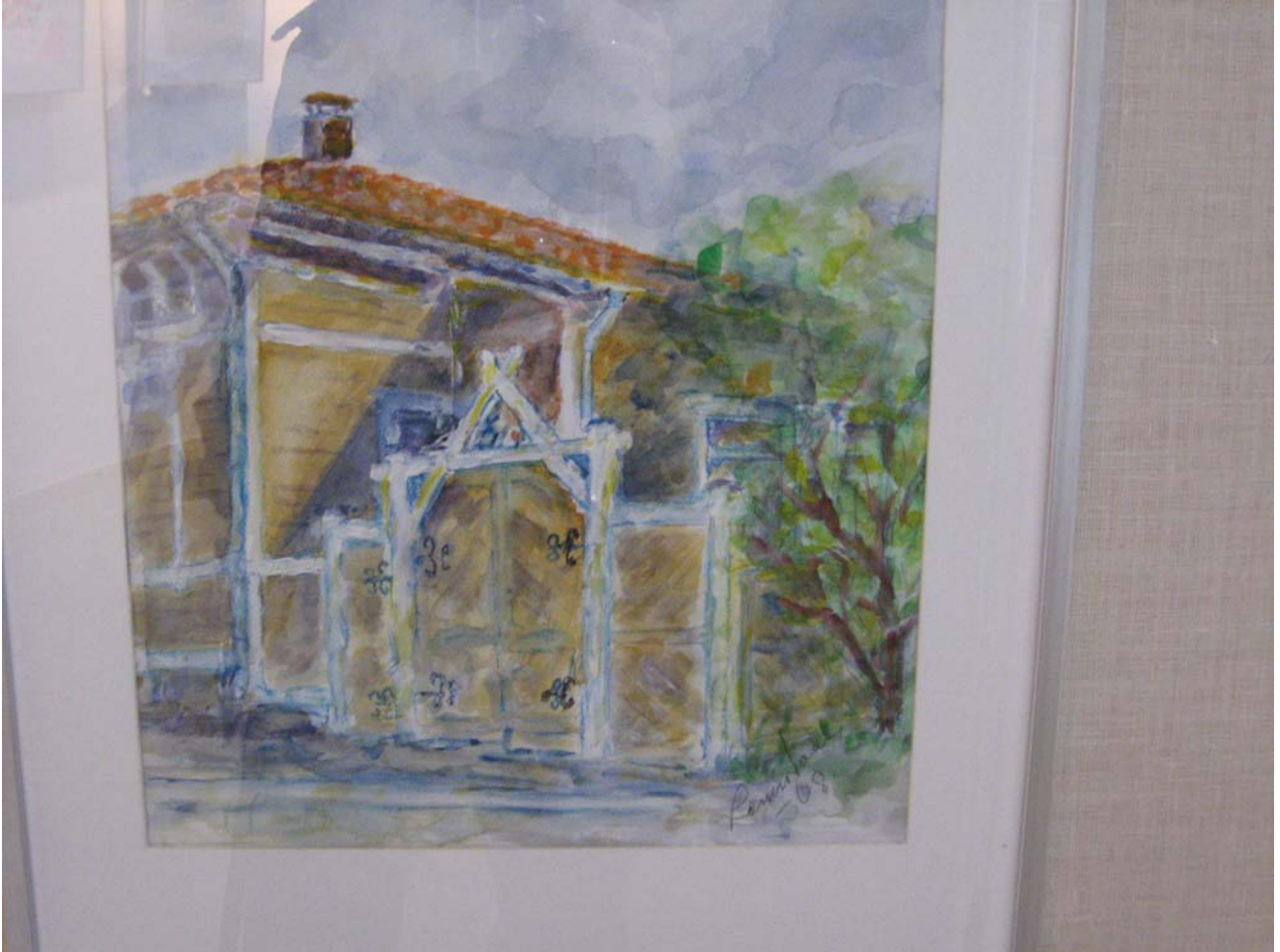
Raimo Saari "Näsilinnankatu 10:n portti" vesiväri 2008

Raimo Saaren työ ”Näsilinnankatu 10: n portti” on kuvattu aika yksityiskohtaisesti ja samalla vaikutelma on kevyt.