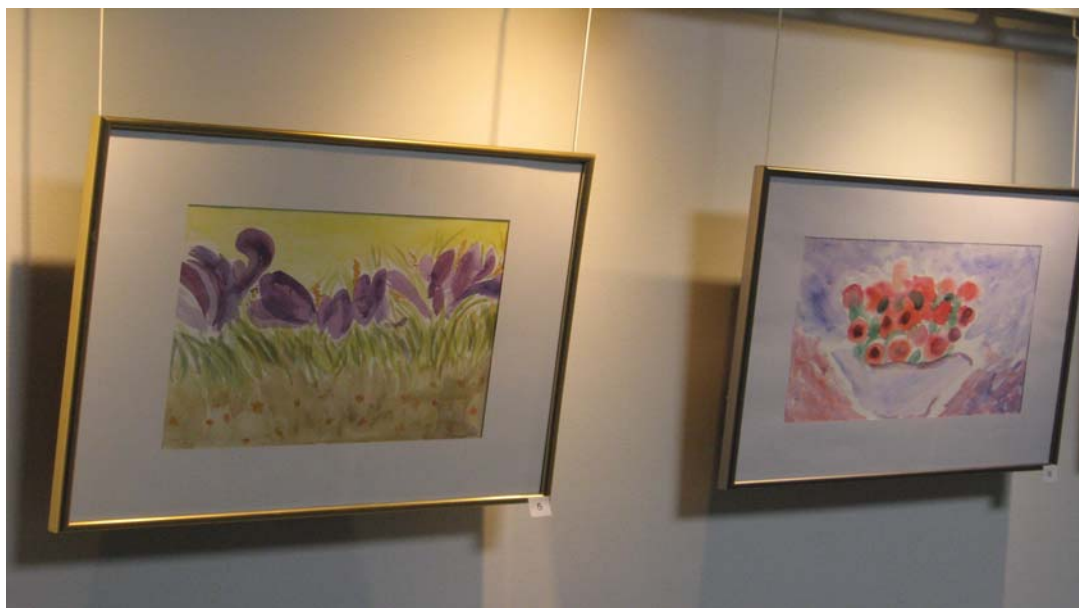
Saija Heino "Kevätkrookukset" vesiväri 2008

Vesiväreillä saa aikaan utuisen tunnelman. Maalaukset antavat väreillä leikittelyn kautta omanlaisensa tunnelman. Yleisesti ottaen maalaukset ovat herkkiä, muttei hapuilevia.